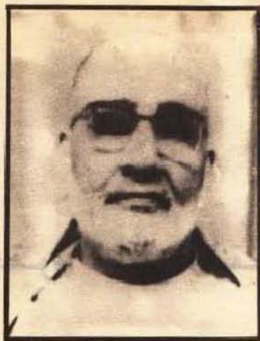
الشيخ مولاي أحمد الطاهري الادريسي الحسني